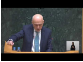
საქართველოს ვიცე-პრემიერის, საგარეო საქმეთა მინისტრის ანდრეასის კრედიტინგის პროცესი