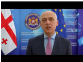
დავით ბალკალიანი ევროკავშირისა და აღმოსავლეთ პარტნიორობის ქვეყნების მინისტრების შეხვედრაში