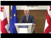
დავით ბალკალიანი საქართველო-აშშ-ის სტრატეგიული პარტნიორობის შეხვედრაში