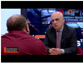
დავით ბალკალიანი კონსTV-ის ეთერში